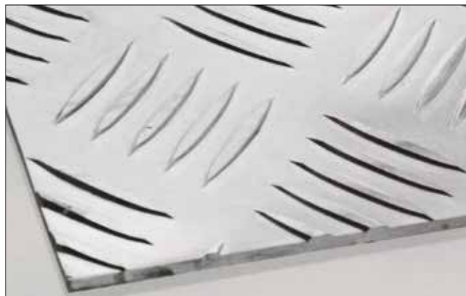
Finitura MANDORLATE ALLUMINIO