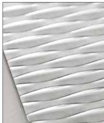
Finitura CHICCHI DI RISO