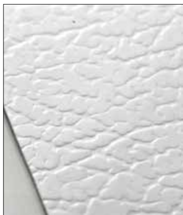
Finitura PELLE DI ELEFANTE